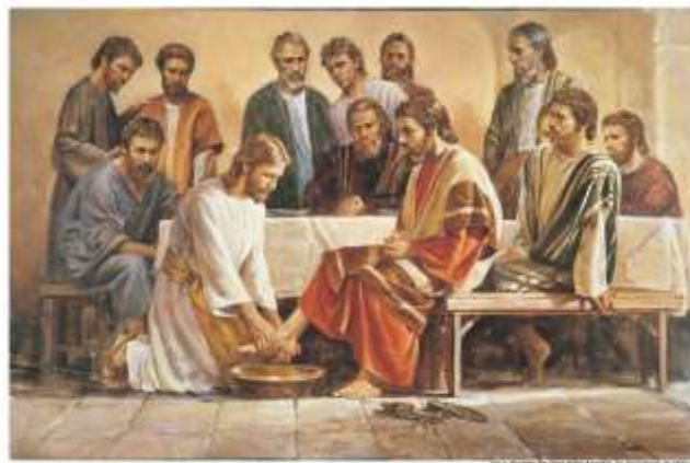
Jesus vasker disiplenes føtter skjærtorsdag

Påskens sentrale fortelling handler om offer, død og oppstandelse. Men høytiden rommer flere tekster og temaer; som for eksempel den historien som har gitt torsdagen sitt navn: Det gammelnorske skira betyr å rense/vaske. På skjærtorsdagen vasket Jesus elevenes føtter (Joh 13,1-17) i tillegg til at han holdt sitt berømte kveldsmåltid.